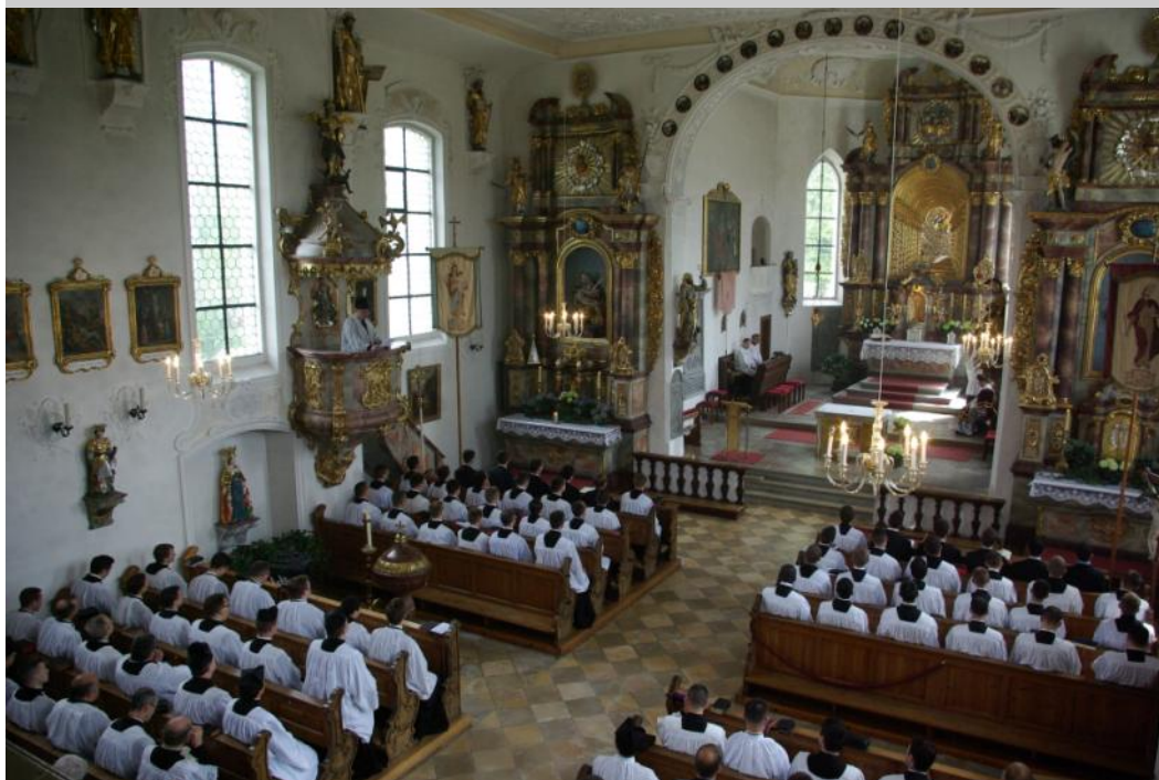
Juin 2013 : prêtres et séminaristes réunis à Wigratzbad pour fêter les 25 ans de la FSSP